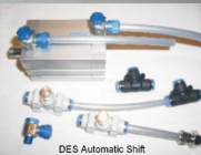
DES Automatic Shift