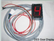
DES Gear Display